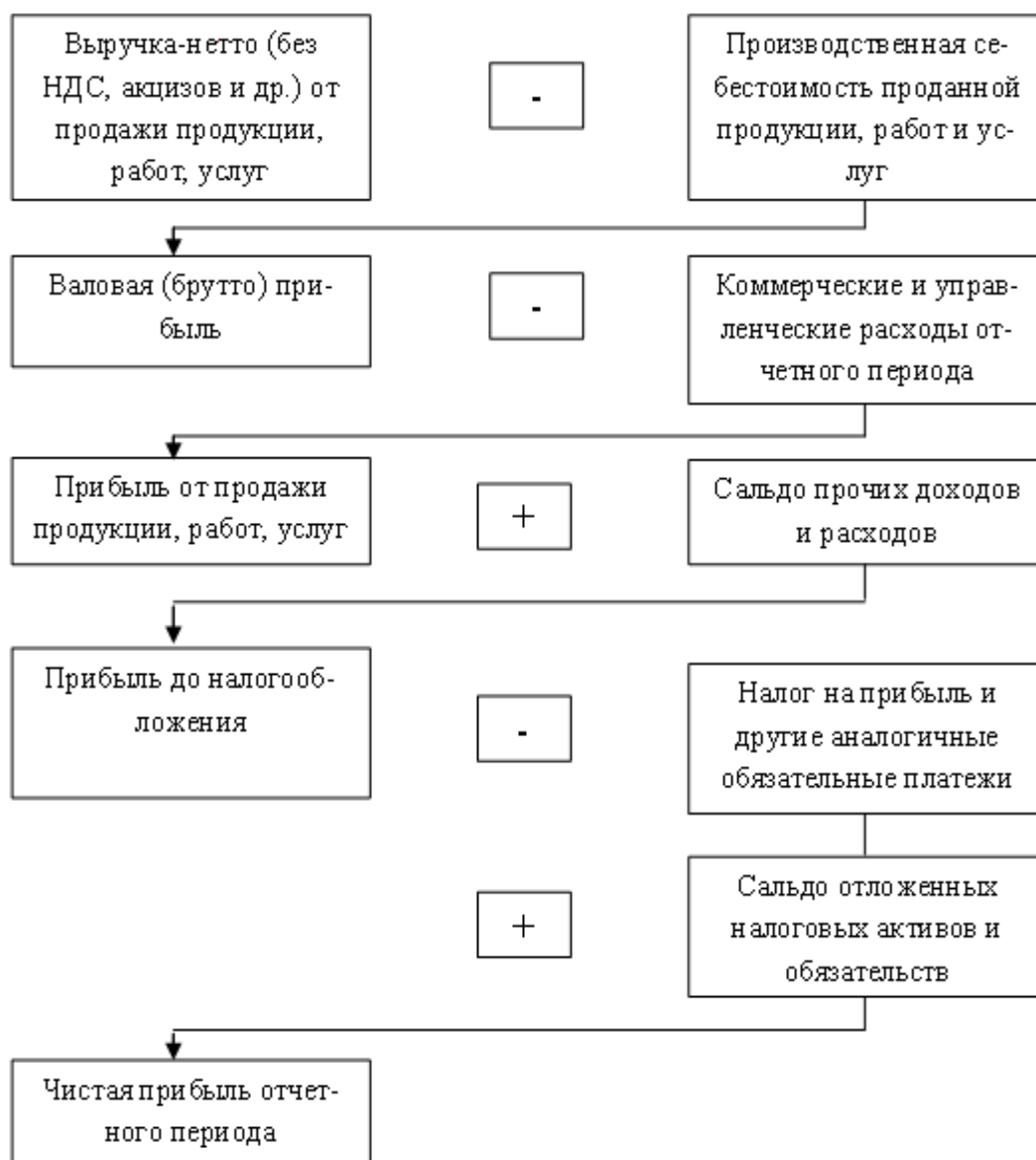
Рис. 19.1. Схема формирования показателей прибыли предприятия